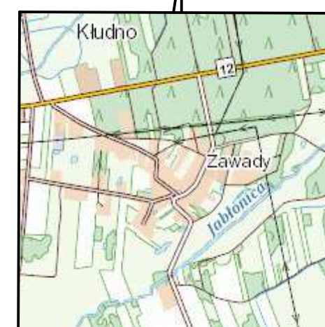
SZKIC ORIENTACYJNY skala 1:25 000